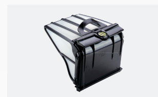
Bac filtrant 5 litres Facile d'accès et de grande capacité